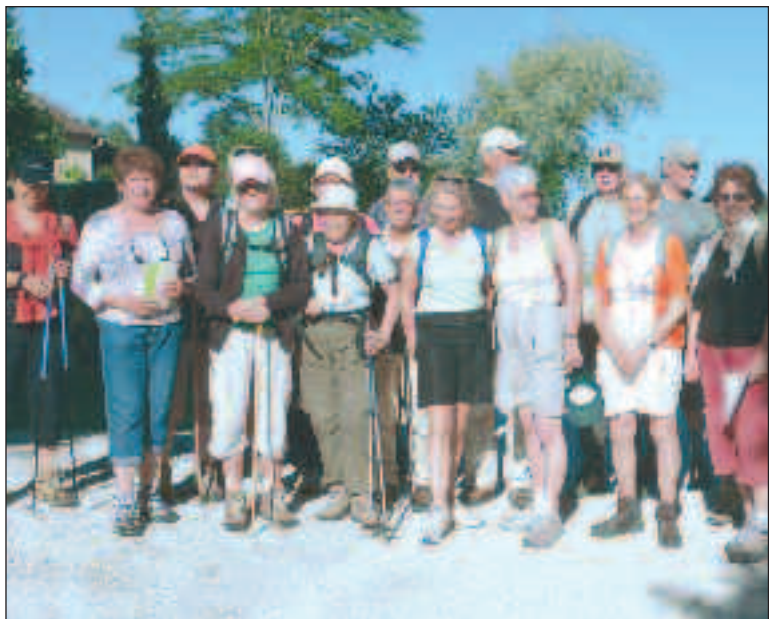
Le groupe au départ de Cladech