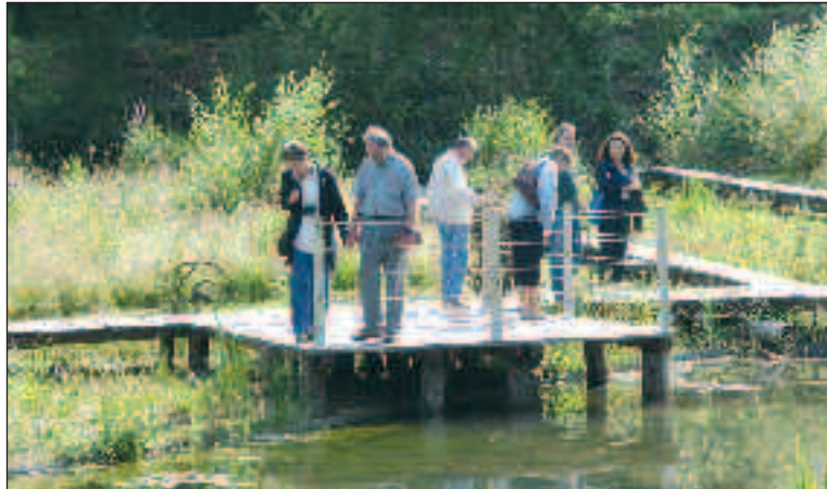
Un parcours au-dessus du jardin d'eau