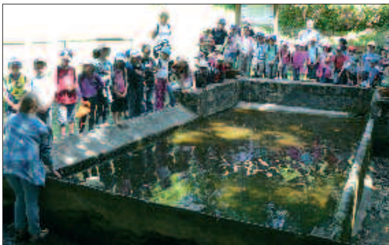
Départ du lavoir