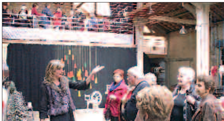
A la filature